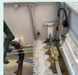
ノズル・スパイラルブラシ